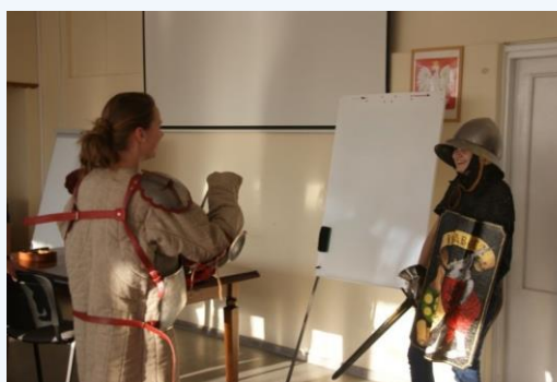
Lekcja kultury rycerskiej